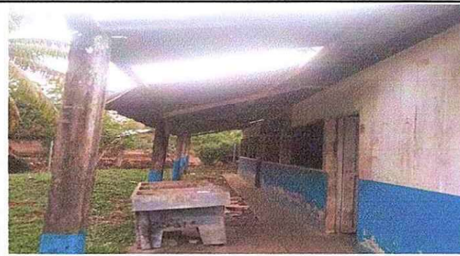
Foto 4. Módulo 2 Se observa el deterioro de las laminas.