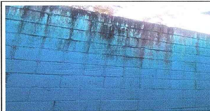
Foto 5. Se observa deterioro de pinturas del interior y exterior.