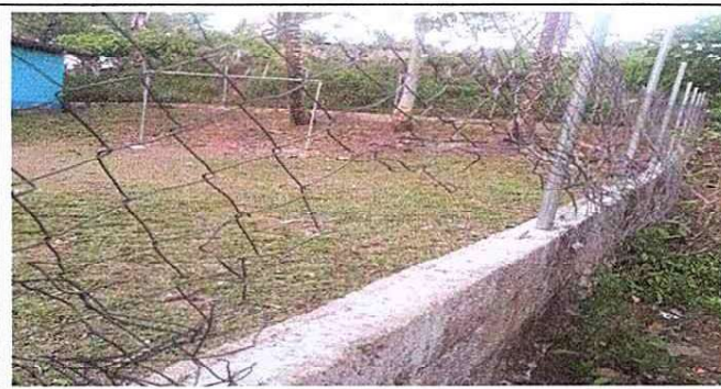
Foto 6. Se observa el deterioro de la malla y los postes.

Observación: Si es necesario se pueden agregar hojas adicionales y actualizar el número de hojas.