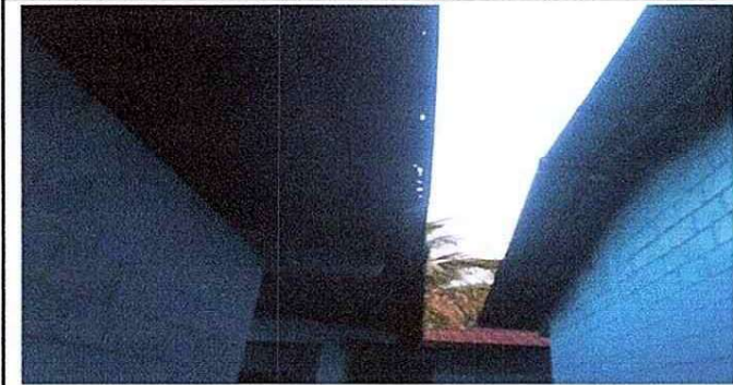
Foto 1. Modulo 1 Se observa deterioro de laminas, costaneras y tijeras.