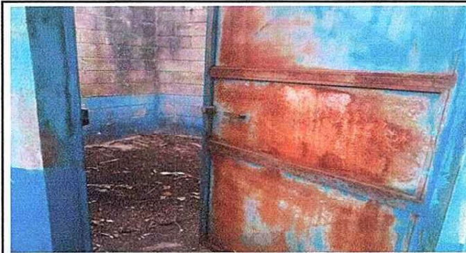
Foto 3. Módulo 1 Se observa derioro de las puertas.